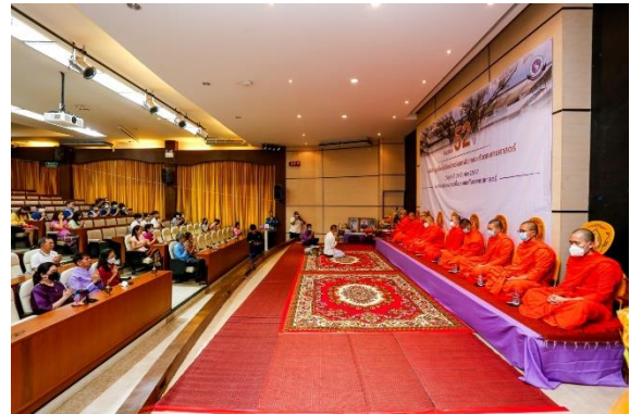
พิธีทำบุญเนื่องในโอกาสครบรอบ 52 ปี 29 มีนาคม 2567 ณ ห้องประชุมสุทธาสีโนบล ชั้น 4 อาคาร 1 คณะทันตแพทยศาสตร์