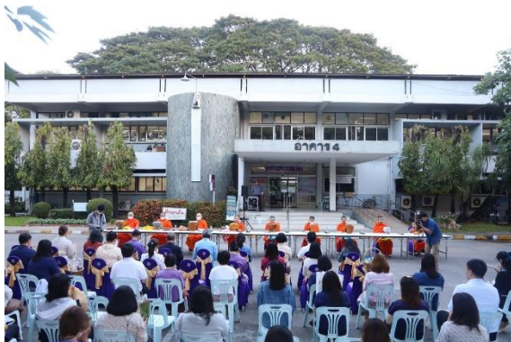
พิธีทำบุญตักบาตรเนื่องในโอกาสวันขึ้นปีใหม่ 2567 5 มกราคม 2567 ณ บริเวณหน้าอาคาร 4 คณะทันตแพทยศาสตร์