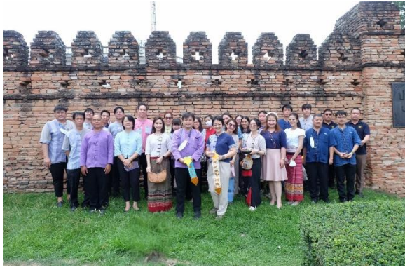
ร่วมพิธีสืบชะตาและพิธีทำบุญเมืองเชียงใหม่ ประจำปี 2567 20 มิถุนายน 2567 ณ หน่วยพิธีประตูสวนดอก