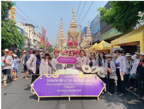
ร่วมเดินขบวนสงกรานต์ มช. 67 13 เมษายน 2567 ณ ถนนเจริญเมืองไปยัง วัดพระสิงห์วรมหาวิหาร