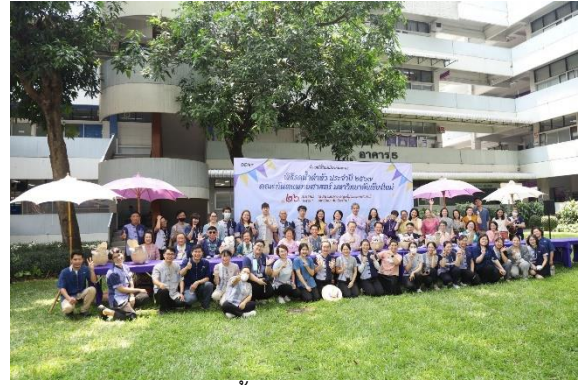
กิจกรรมรดน้ำดำหัว ประจำปี 2567 26 เมษายน 2567 ณ คณะทันตแพทยศาสตร์