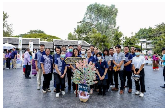
พิธีทอดถวายผ้ากฐินมหาวิทยาลัยเชียงใหม่ ประจำปี 2566 25 พฤศจิกายน 2566 ณ วัดฝายหิน