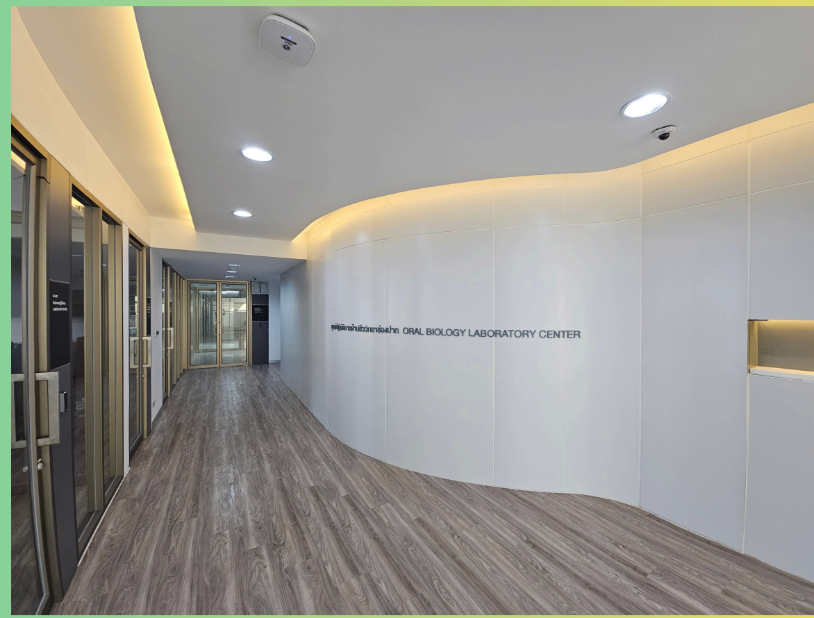
ชั้น 3 ศูนย์ปฏิบัติการด้านชีววิทยาช่องปาก โทร 053-944442