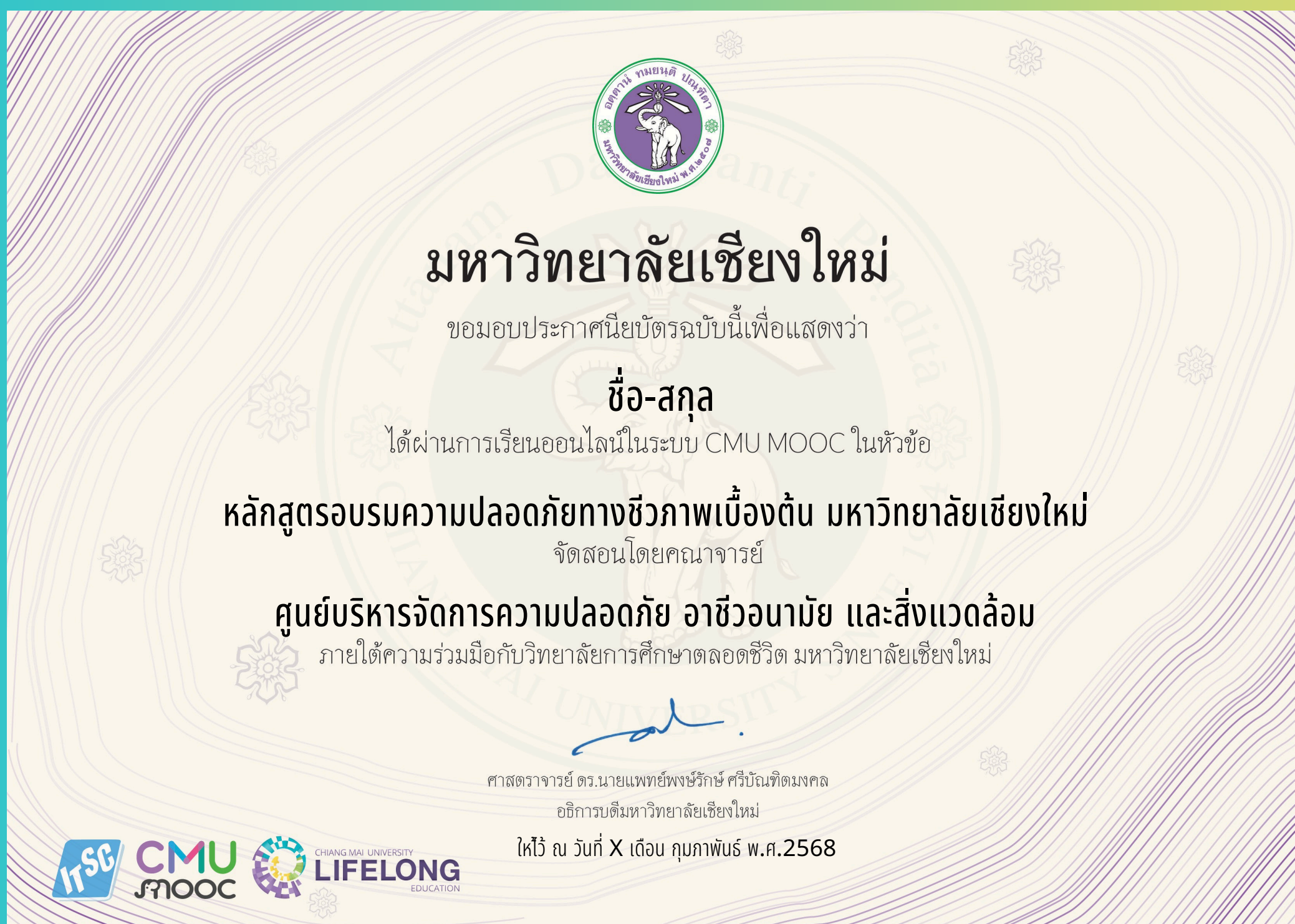
ตัวอย่างเอกสารแนบ